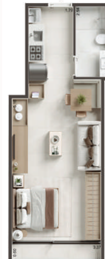
COLUNA 05 - STUDIO