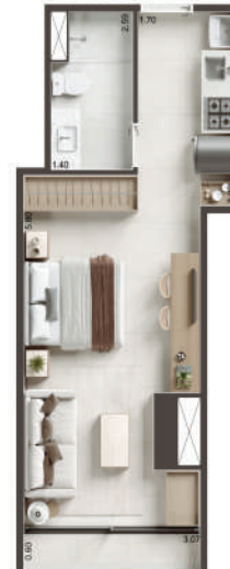
COLUNA 04 - STUDIO