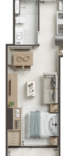
COLUNA 06 - STUDIO