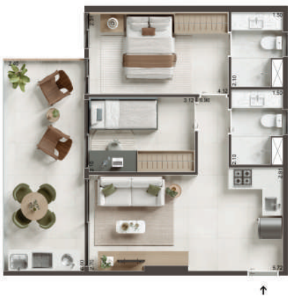
COLUNA 01 - 2 QUARTOS COM VARANDA