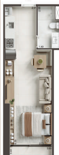
COLUNA 03 - STUDIO