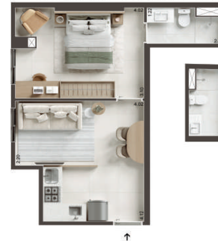
COLUNA 11 - 1 QUARTO SEM VARANDA