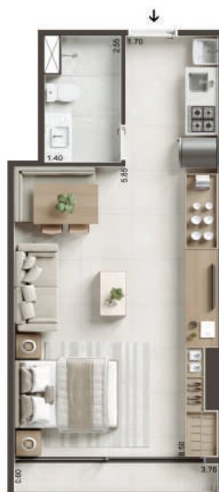
COLUNA 08 - STUDIO