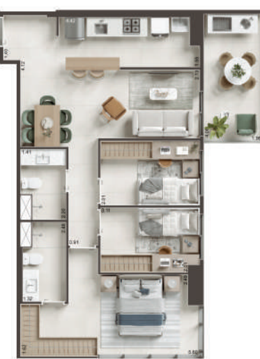
COLUNA 09 - 3 QUARTOS COM VARANDA