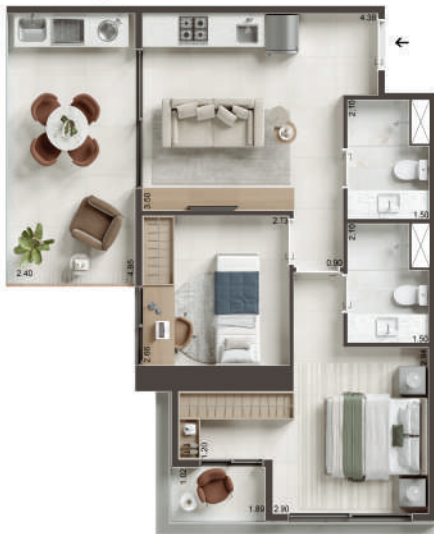
COLUNA 02 - 2 QUARTOS COM VARANDA